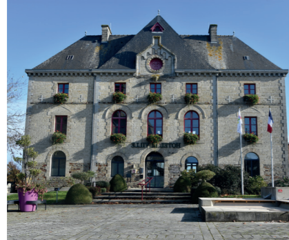
Hôtel de Ville, Montauban-de-Bretagne